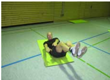
Schon viele Jahre mit großer Begeisterung dabei, Arno Stüwer.